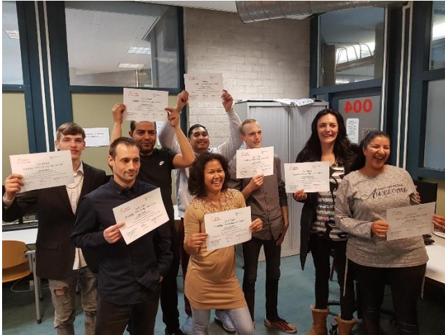
Blij en trots met de certificaten

De projectleider geeft tijdens de trainingsperiode een les over fondswerving aan zowel de leerlingen als de begeleiders. Van hen wordt verwacht dat zij hun aangemelde kandidaat ondersteunen bij het vinden van fondsen voor het bekostigen van een studie. Hierbij valt te denken aan studiegeld, lesgeld en boekengeld. De begeleider zoekt samen met de kandidaat een geschikte BBL plek. Indien dit niet lukt ondersteunt de projectleider de begeleider en de kandidaat hierin. Bij het vinden van een geschikte BBL-plek wordt soms ook beroep gedaan op de leerwerkmakelaar.