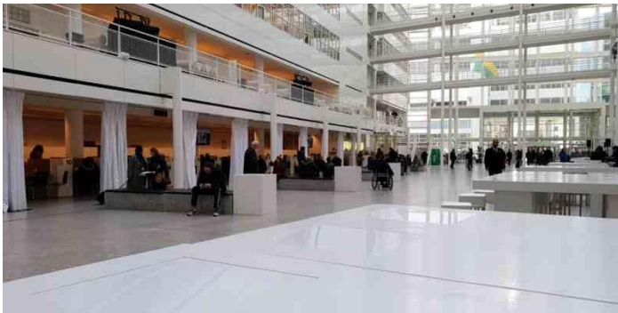
Atrium van het stadhuis Den Haag

Twee Achterban jongeren en een medewerker van het Straat Consulaat zijn vertegenwoordigd in de deelraad Jeugd en de brede raad.