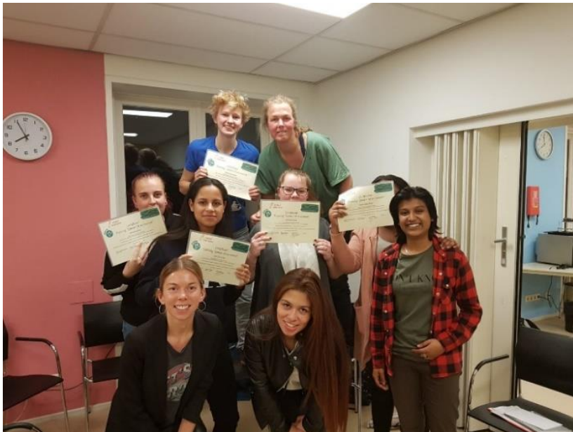
De training zit er op

In mei 2019 werd duidelijk dat het werven van respondenten minder voorspoedig verliep dan verwacht. Er werden tot dan toe 13 (van de verwachte 40) interviews uitgevoerd en de verwachting was dat er op redelijk korte termijn nog 10 interviews kunnen worden gehouden.